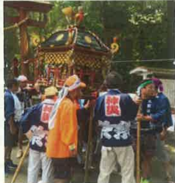
集落のおまつり等のサポート