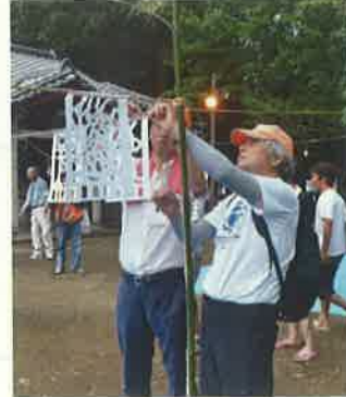
神楽などの伝統芸能のサポート