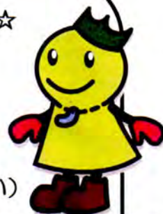
環境マスコット「こぶんちゃん」