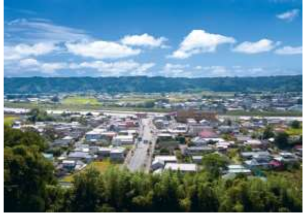
木城町の中心部の風景