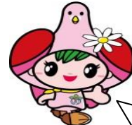
女性?代表 クウちゃん

ねえねえ、キックン 木城の男性は「はや食い」 で「晩酌」の量もよそより 少し多いっちゃね キックンも今より おなかが出ないように もう少し「ゆっくり食べて」 「野菜」も増やしてね