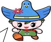
男性?代表 キックン

クウちゃんも、「夕食後」 たまに食べたりしちよるよね BMIに注意やね(苦笑) 野菜も食べているよ~とか いいながら、漬物とかが 多いとかもしれんよ~ 木城町は、血圧が高い人が 多いうて聞いたから 「塩分」は控えんといかんね